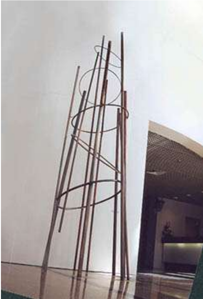
International Plaza Hotel SP - Hall de entrada Obra: Asencional Data: 2000 Técnica: Tubos de Cobre e Latão soldado Dimensões: diâmetro base 170cm, altura 500cm

O artista transita por diferentes materiais, suportes e espaços. Projeta obras públicas para o corpo da cidade e projeta, igualmente, peças para o corpo feminino, pois é designer de jóias.